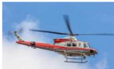
青森県防災ヘリコプターしらかみ